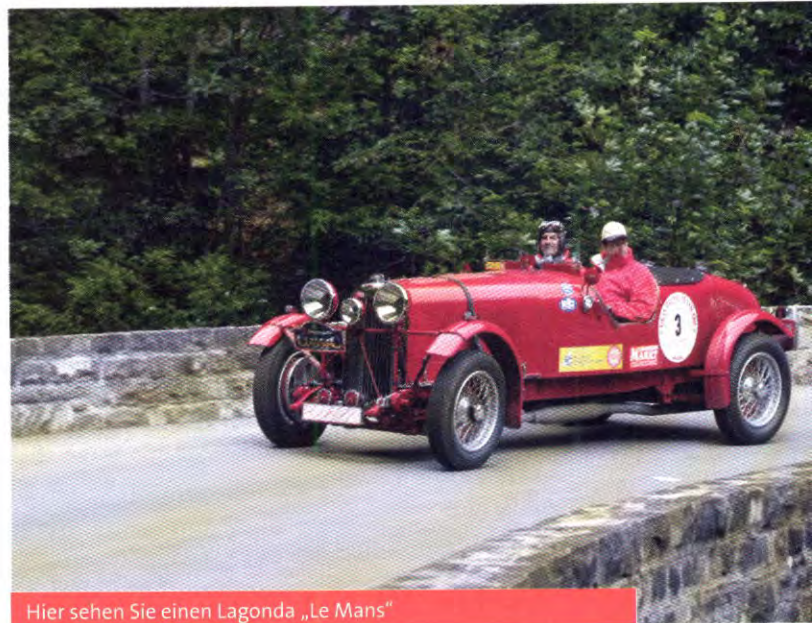
Hier sehen Sie einen Lagonda „Le Mans“

Fordern Sie gleich die Ausschreibungsunterlagen unter der Telefonnummer 0711 662-7233 66 bei unserem Organisationsteam an. Oder besuchen Sie unsere Rallye im Internet unter www.wuerttembergische-classic.de